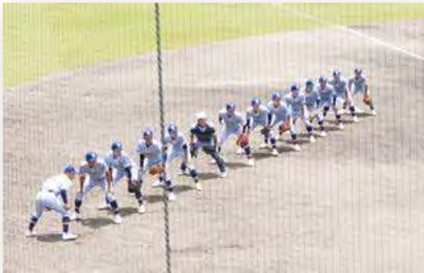
健闘した一期生たち