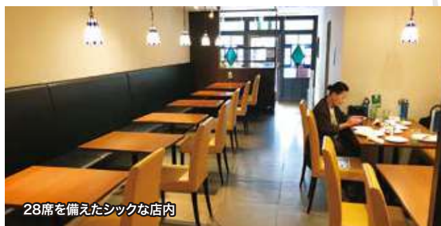
28席を備えたシックな店内

客の7～8割がオーダーする一番人気の「寺町ハンバーグステーキ(200g)」(ライス付き/税込1,500円)を始め、原さん自慢の料理に還元水は欠かせない“相棒”だ。