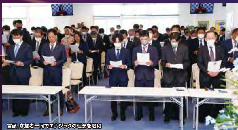
冒頭、参加者一同でエナジックの理念を唱和