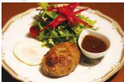
一番人気の「寺町ハンバーグステーキ」