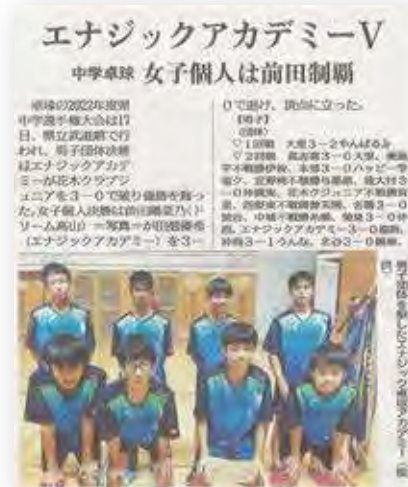
優勝を報じる『沖縄タイムス』(7月19日付)

大会は1回戦から5回戦(決勝)までのそれぞれで、シングル4ゲーム+ダブルス1ゲームの合計5ゲームで争われ、エナジック卓球アカデミーチーム