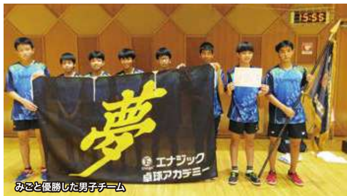
みごと優勝した男子チーム

7月17日に沖縄県立武道館でおこなわれた「沖縄県中学校卓球選手権大会」の男子団体戦の部で、エナジック卓球アカデミーの中1と中3の生徒で構成するチームがみごと優勝しました。出場33チームのうち中学の部活動チームが30を占め、エナジック卓球アカデミーは残りのクラブチームの1つとして参加しました。