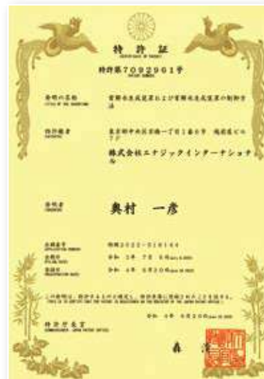
6月20日に登録された発明の特許証

これにより、エナジックのレバラックシリーズは、ますます優れた製品となって世に送り出されることでしょう。