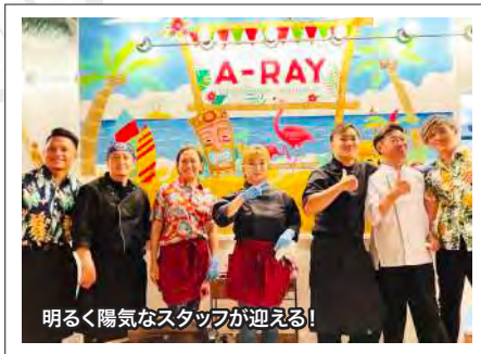
明るく陽気なスタッフが迎える!