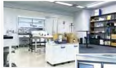
ここからきっと新技術や発明が誕生!

その成果として、センター設立以前からの研究ですが、下記記事のとおり、6月には特許庁から電解槽の洗浄に関する制御方法で特許を取得しました。今後の研究の進展に、大いに期待しましょう!