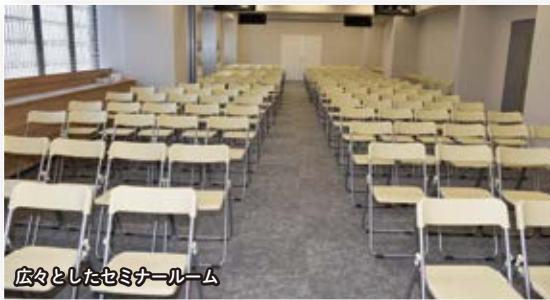
広々としたセミナールーム