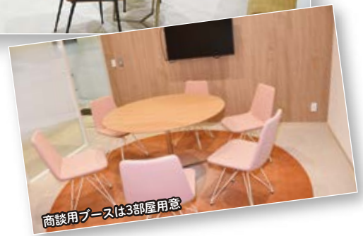
商談用ブースは3部屋用意

〒104-0031 東京都中央区京橋1-1-6 越前屋ビル7F 電話：03-5205-6032 FAX：03-5205-6035