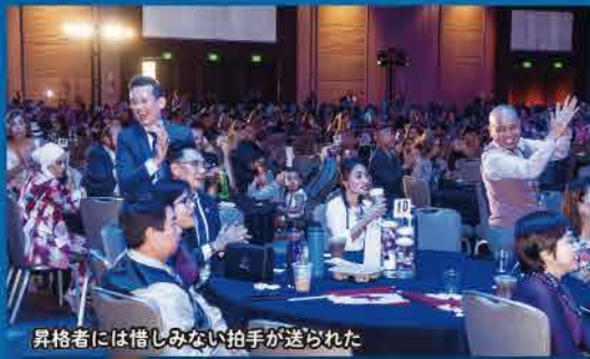
昇格者には惜しめない拍手が送られた

壇上に次々に呼ばれて紹介された昇格者の皆さんは、揃って喜びにひたり、中には来し方の苦勞を思っか、感極まって涙ぐむ人もいました。本号では9月号の続編として、昇格式でランクアップを認定された販売店の皆さんを紹介します。