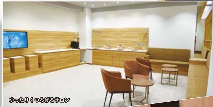
ゆったりくつろげるサロン