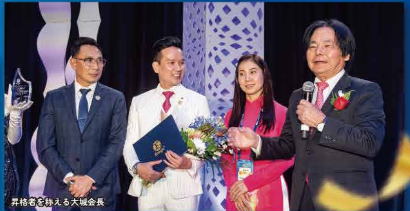
昇格者を称える大城会長