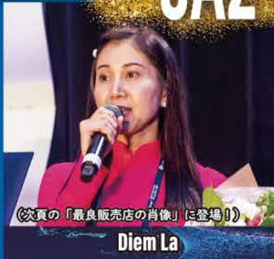
(次頁の「最良販売店の肖像」に登場!)