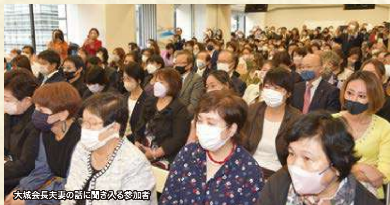
大城会長夫妻の話に聞き入る参加者

「ここからエナジックは始まりました。思い出の場所です」などと万感の思いを込めて来し方を振り返り、参加者から共感の念のこもった温かい拍手が送られました。