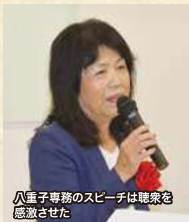
八重子専務のスピーチは聴衆を感激させた