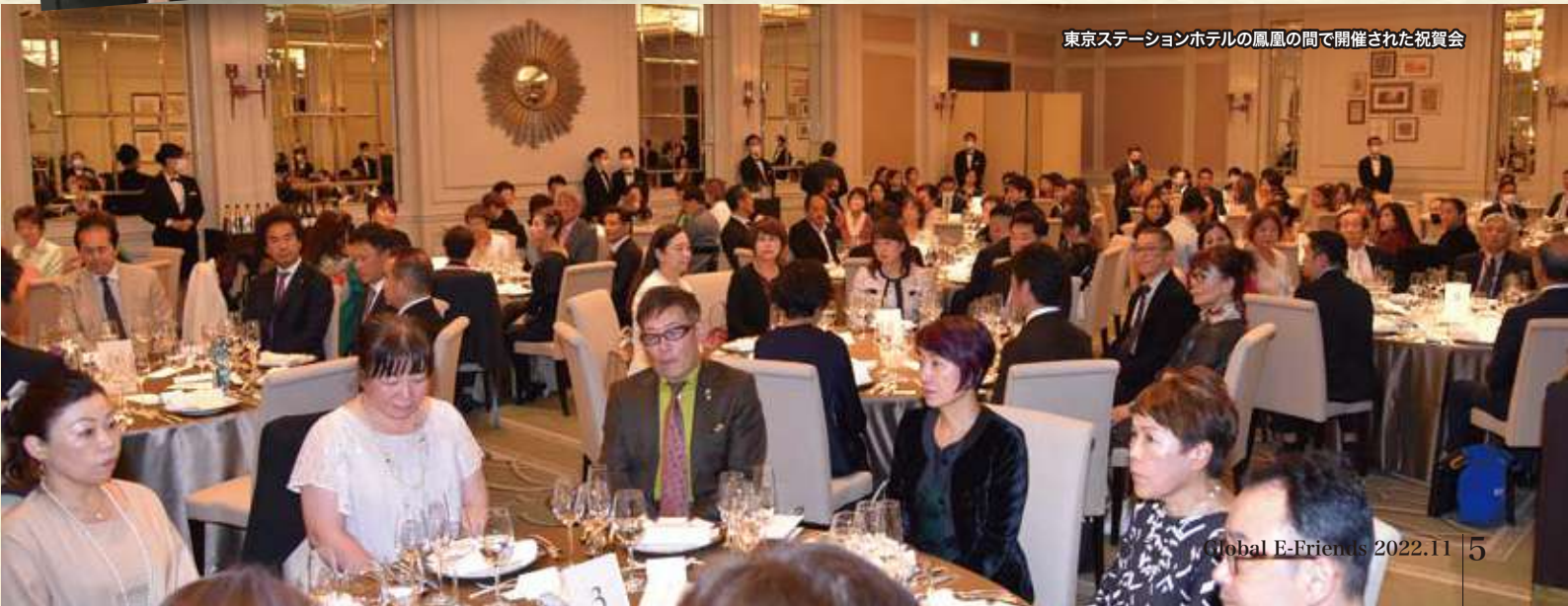
東京ステーションホテルの鳳凰の間で開催された祝賀会