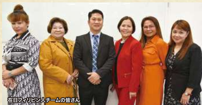
在日フィリピン人チームの皆さん