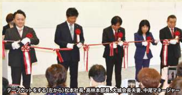
テープカットをする(左から)松本社長、高林本部長、大城会長夫妻、中尾マネージャー

午後1時からのイベントにはおよそ400人の参加者があり、立ち見を含めてもセミナールームに入りきらず、外で聞いていただく方も出るほどの大盛況となりました。グローバルな展開を証明するように、フィリピン人やベトナム人など外国人の参加者も多くみられました。