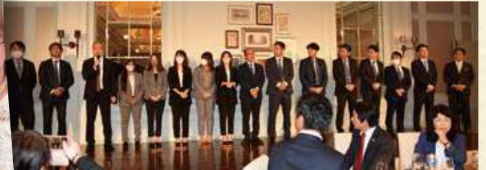
壇上で一人ひとり紹介された日本のエナジック社員