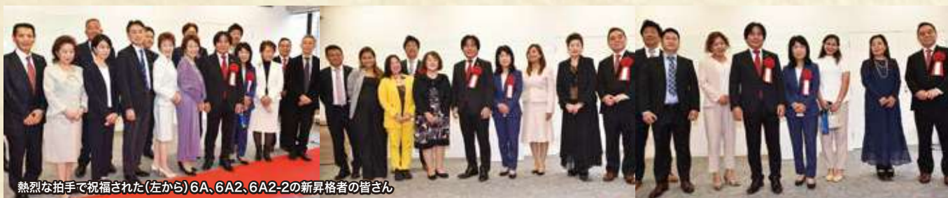
熱烈な拍手で祝福された(左から)6A、6A2、6A2-2の新昇格者の皆さん

その後、6A、6A2、6A2-2に昇格した販売店の皆さんが紹介され、イベントは終了しました。