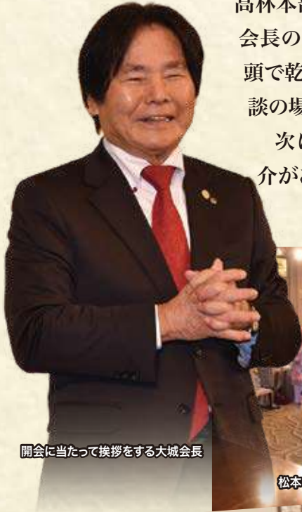
開会に当たって挨拶をする大城会長