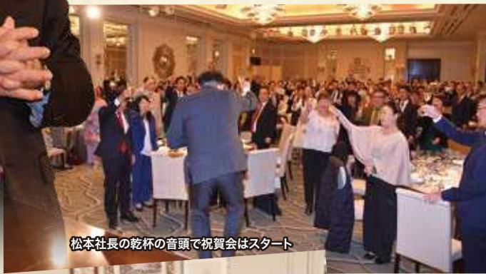
松本社長の乾杯の音頭で祝賀会はスタート