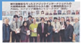
地域に感謝、子ども育成を名護エナジック 旧久志小校区5区に寄付