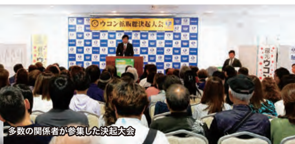
多数の関係者が参集した決起大会