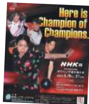
大会ポスター

大会の優勝・入賞者、および全日本ナショナルチームメンバーだけが参加できる、という厳しい条件が付いています。したがって「真の日本一」を決める大会と言っても差し支えありません。おめでとうございます!