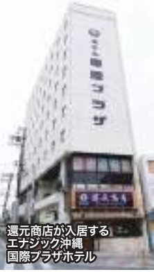
還元商店が入居する エナジック沖縄 国際プラザホテル

このほど、著名な観光地の沖縄・国際通りに面したエナジックグループのエナジック沖縄国際プラザホテル1階・地下1～2階に、居酒屋「還元商店」がオープンしました。100人は優に入れる規模があり、エナジックグループの沖縄還元フーズが作る還元ウコンとカンゲンファームが生産する還元牛、そしてエナジック車海老養殖場で育てた車海老をメインにした料理が特長です。