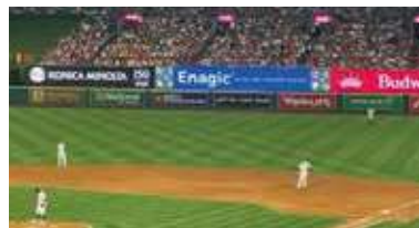
Enagicの巨大なディスプレイ広告

大なディスプレイ広告の展示を始めた。球場に来る人たちはもちろん、テレビやニュース映像に映し出された外野フェンスを見れば、「Enagic」の大きな文字が目に入って来るだろう。なお、球場内施設にレバラックを設置することも決まった。観客やひよっとしたら選手も還元水を飲むようになるかもしれない。