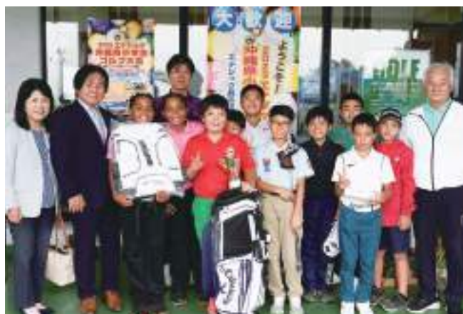
表彰式で子どもたちを称えた大城会長夫妻