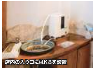
店内の入り口にはK8を設置

還元商店(エナジック沖縄国際プラザホテル内) 〒900-0014 那覇市松尾1-4-10(国際通り沿い) 電話:098-869-4129(ヨイニク)