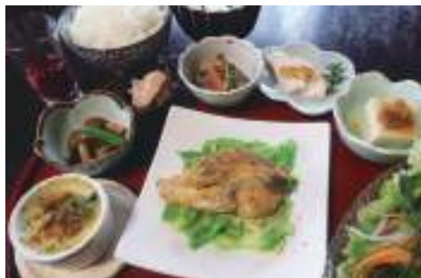
一番人気の「気まぐれランチ」