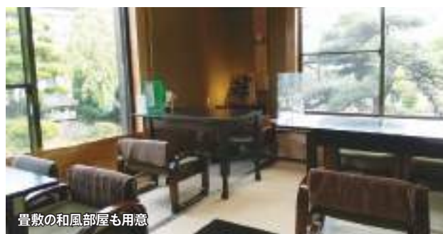
畳敷の和風部屋も用意

ゆずり葉はまた、60年ほど前に建てられた農業用倉庫をレンタルギャラリーとして開放し、コンサート、展示会、各種の催しに活用されている。「お客様」は、美味しく安全な料理だけでなく文化の香りにも引き付けられているようだ。