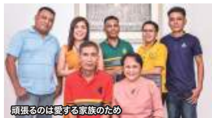
頑張るのは愛する家族のため

当初は介護職との2本立てで、主に在日フィリピン人にエナジック情報を伝えていった。その後、チームが大きくなっていった2021年にはエナジックビジネス一本に絞るようになった。そして同年6月に6A、22年6月に6A2、今年4月には6A2-2と、順調に昇格した。両親と兄、弟2人、妹の6人家族への仕送りもスムーズにいくようになり、昨年には故郷のミンダナオ島ダバオ市に新築の家を建てるまでになった。