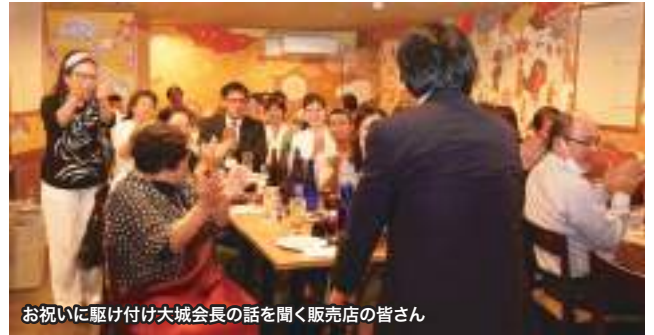
お祝いに駆け付け大城会長の話を聞く販売店の皆さん

還元商店(エナジック沖縄国際プラザホテル内) 〒900-0014 那覇市松尾1-4-10(国際通り沿い) 電話:098-869-4129(ヨイニク)