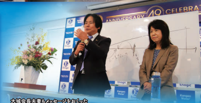
大城会長夫妻もメッセージをおくった