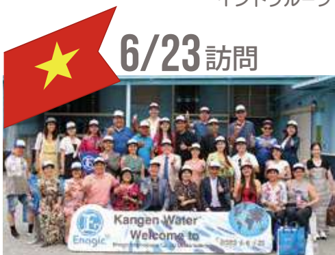
ベトナムグループ