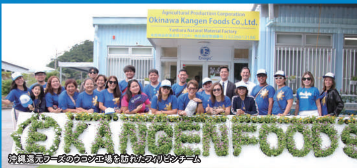
沖縄還元ファーズのウコン工場を訪れたフィリピンチーム

さん（6A3-2）のグループの皆さんがE8PAで相次ぎセミナーを開催し、参加者は充実した時間を過ごしました。