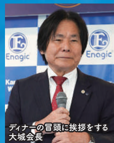
ディナーの冒頭に挨拶をする大城会長