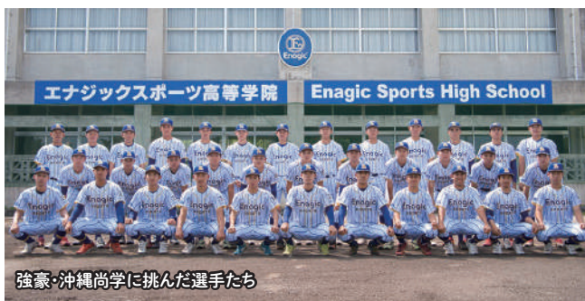
強豪・沖縄尚学に挑んだ選手たち

エナジックスポーツ高等学院野球部が夏の甲子園をめざす県大会に出場しました。1、2回戦共にコールドで勝つ勢いでしたが、7月4日の3回戦では春夏連続出場を狙う強豪・沖縄尚学に0対3という僅差で敗退しました。しかし「1・2年生のみの新鋭チーム・エナジックが健闘」といった評価を得ました。7月末から始まる新人大会の活躍が大いに期待されます。