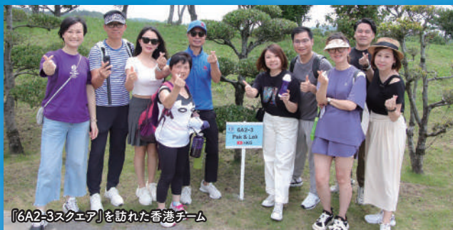
「6A2-3スクエア」を訪れた香港チーム