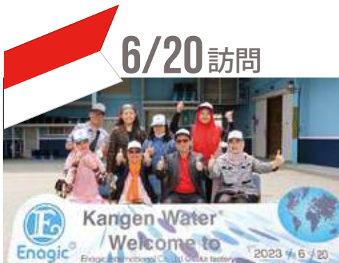
インドネシアグループ