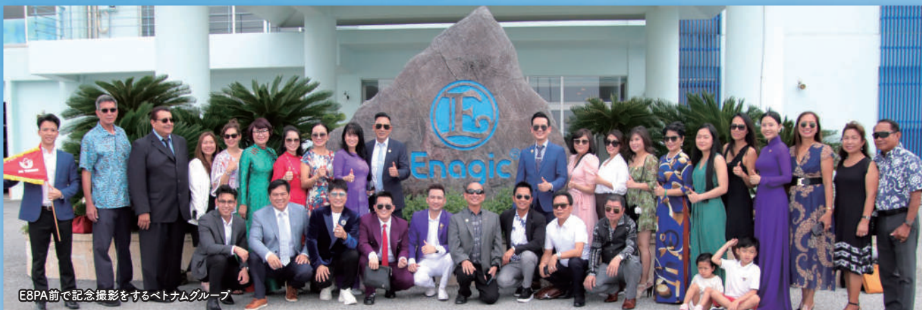
E8PA前で記念撮影をするベトナムグループ