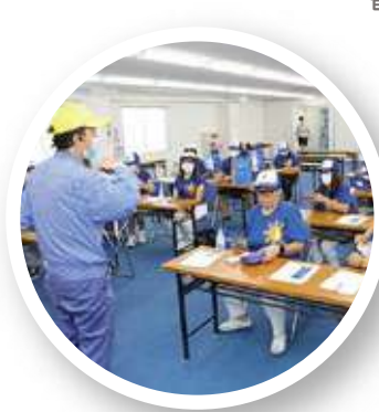
工場2階ホールで説明を受ける (フィリピングループ)