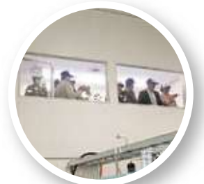
樹脂成型工程を見る (ベトナムグループ)