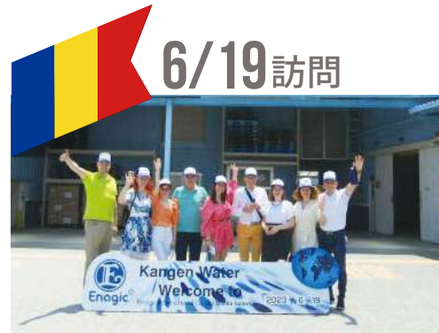
ルーマニアグループ

6月19～23日の間にルーマニア、インドネシア、フィリピン、インド、香港、ベトナムの販売店グループが大阪工場を訪問しました。樹脂成型やカートリッジ製造から機器の組み立てまで、レベラックの生産工程を熱心に見学し、メイドインジャパンの確かさを実感していました。