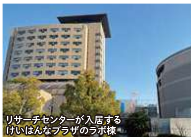
リサーチセンターが入居する けいはんなプラザのラボ棟

昨年4月、エナジック インターナショナルの 研究部門として、京都 府相楽郡精華町の「け いはんなプラザ」ラボ棟 内に設立されたりサー チセンターに、このほど