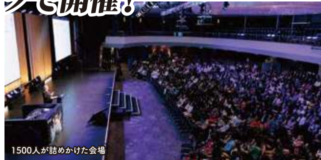
1500人が詰めかけた会場

主要イベントは、30人以上の各国のトップリーダーが二日間にわたっておこなったセミナーで、それぞれの視点からユニークなス