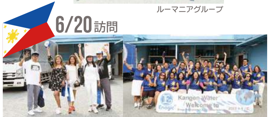
フィリピングループ①