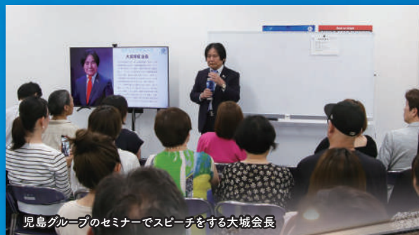
児島グループのセミナーでスピーチをする大城会長