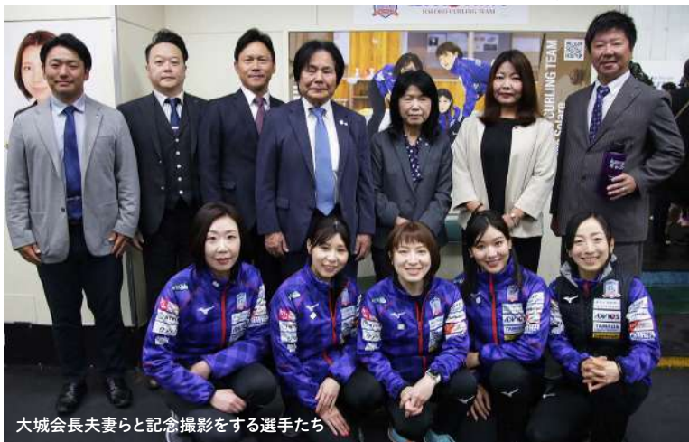
大城会長夫妻らと記念撮影をする選手たち

6月24日、 はえぼる 沖縄県南風原町のエナジックスポーツワールドサザンヒル・アイスアリーナで、昨年の北京五輪女子カーリングで銀メダルを獲得した北海道北見市のチーム「ロコ・ソラーレ」を招き、カーリング教室が開催されました。