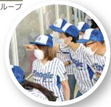
組立工程を見学する (香港グループ)