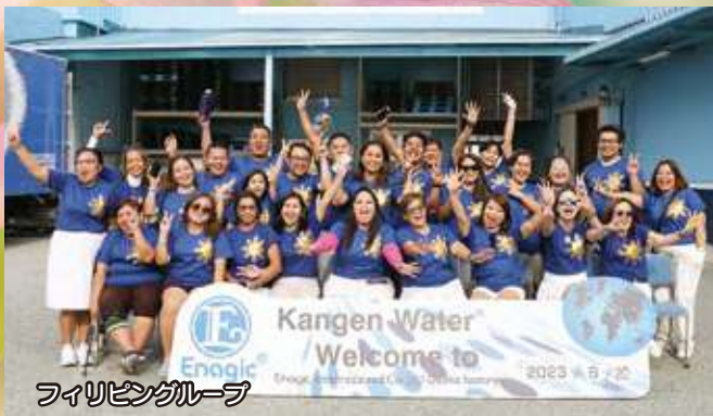
ワイリエングループ