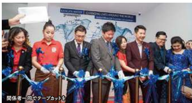
関係者一同でテープカットを

6月17日午後、カンボジアの首都プノンペンの会場で、エナジックカンボジアのサービスプラザのグランドオープンを記念するイベントが開催されました。ASEAN(東南アジア諸国連合/10カ国加盟)では、フィリピン、タイ、マレーシア、シンガポール、インドネシアに次ぐオフィスです。