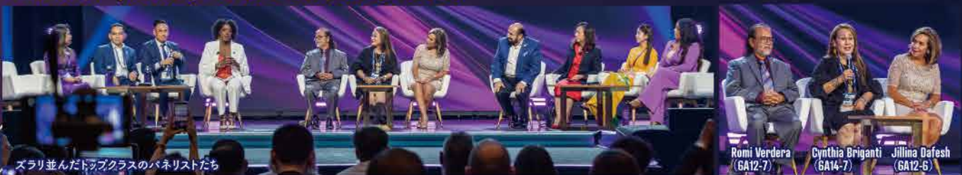
ズラり並んだトップクラスのパネリストたち