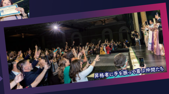
昇格者に手を振って喜ぶ仲間たち