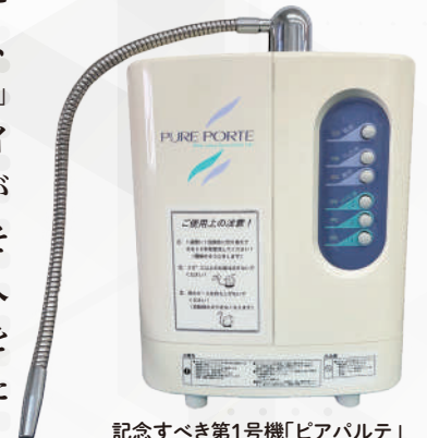
記念すべき第1号機「ピアパルテ」

とはいえコトは始まった。そしてこの当時、某テレビ局が医療分野おけるアルカリイオン水の効果効能を大々的に報じたことがキッカケとなって、業界では「水バブル」といわれるアルカリイオン水の大ブームが巻き起こっていた。その最中に新規参入メーカーとして製品を発売することになったのだった。