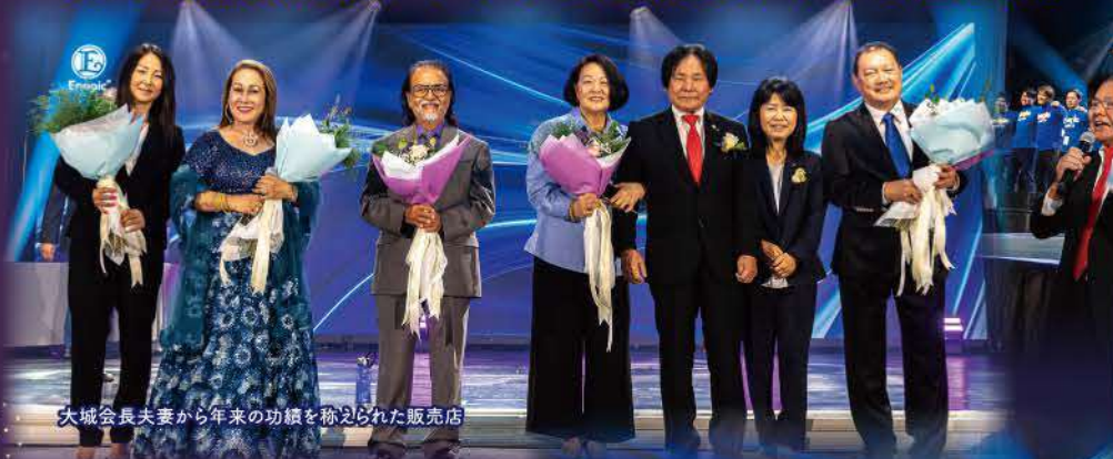
大城会長夫妻から年来の功績を称えられた販売店