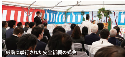
厳粛に挙行された安全祈願の式典