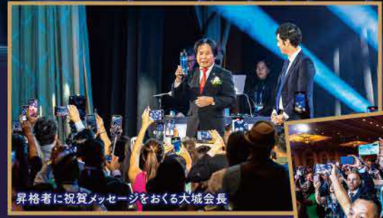
昇格者に祝賀メッセージをおくる大城会長