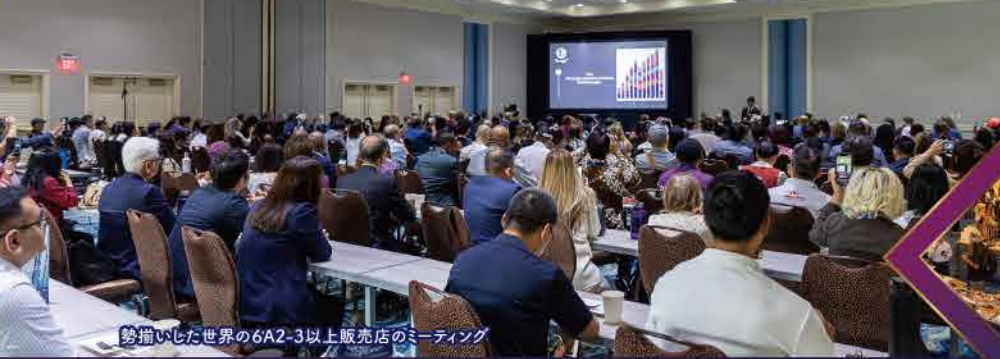
勢揃いした世界の6A2-3以上販売店のミーティング