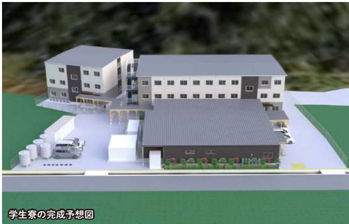
学生寮の完成予想図