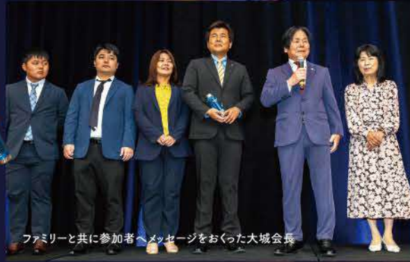
ファミリーと共に参加者へメッセージをおくった大城会長