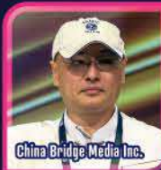
China Bridge Media Inc.