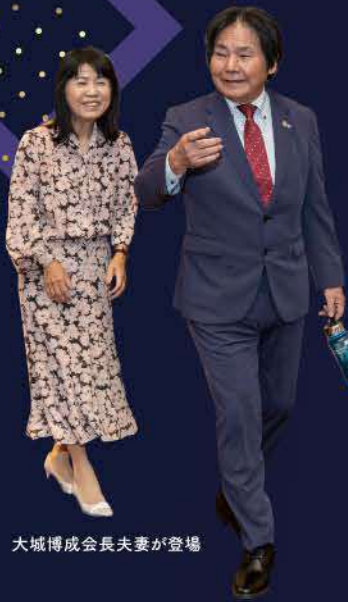
大城博成会長夫妻が登場