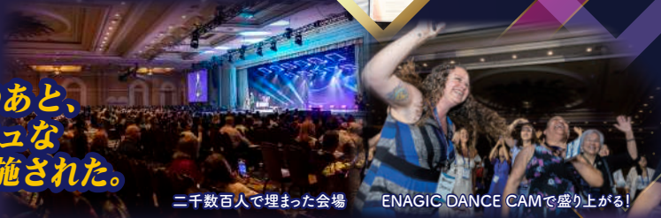
二千数百人で埋まった会場 ENAGIC DANCE CAMで盛り上がる!

10時からの 「ウコンプレゼンテーション」のあと、 4人の講師によるエネルギッシュな トレーニングが午前中いっぱい実施された。