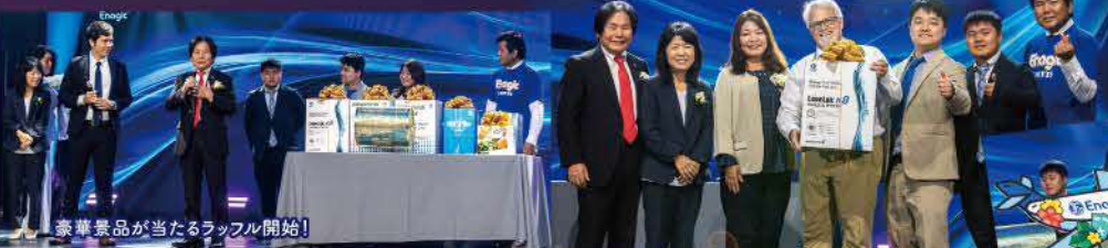
豪華景品が当たるラッフル開始!