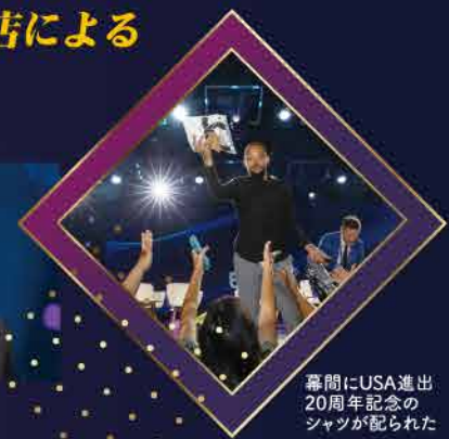
幕間にUSA進出20周年記念のシャツが配られた