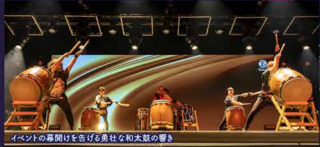
イベントの幕開けを告げる勇壮な和太鼓の響き

現地時間の7月18～19日、ミネバダ州ラスベガスのミラージュホテルで「ENAGIC 49th ANNIVERSARY GLOBAL CONVENTION 2023・LAS VEGAS」が開催され、各国から約2,300人の販売店が参加しました。以下、バラエティに富んだこのイベントを、写真を中心に紹介します。