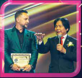
大城会長に称えられる6A2-6の2人

昇格認定式のあとイベントは終盤に入り、 数々の感動的なプログラムで締めくくりを迎えた。