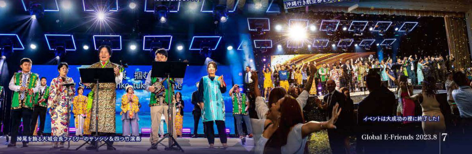
掉尾を飾る大城会長ファミリーのサンシン&四つ竹演奏