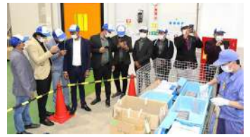
熱心に見学をするインドの販売店

各ポジションを巡ってじっくり見学をしました。途中、説明役の社員に質問をする姿も見られ、「メイド・イン・ジャパン」の現場をしっかりと目に焼き付けていました。