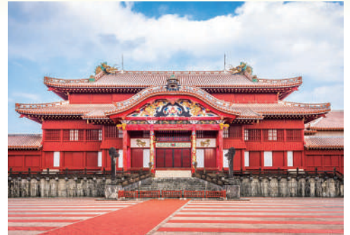
消失前の首里城正殿

(2023年から数えて)はるか565年前にも強く志向され、連綿と受け継がれてきた「海外へ」との気概を見ると、19世紀後半以降の移民の要因を、単に「貧困と国策」だけに求