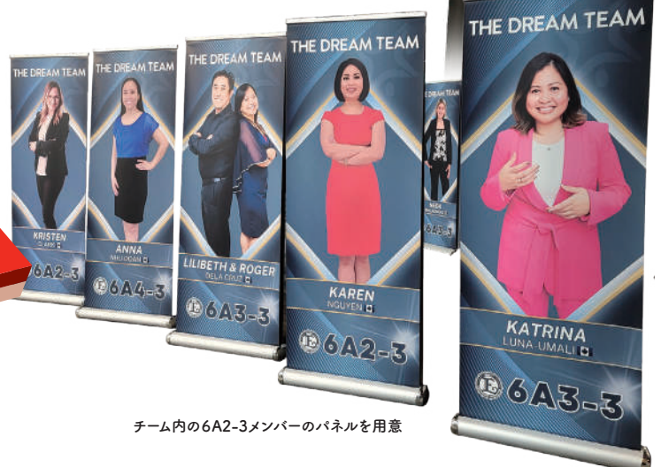
チーム内の6A2-3メンバーのパネルを用意