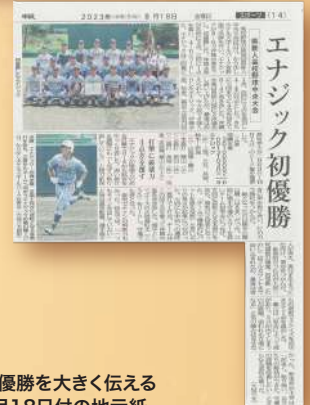
初優勝を大きく伝える 8月18日付の地元紙 (左が『沖縄タイムス』で右は『琉球新報』)