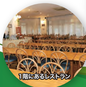
1階にあるレストラン