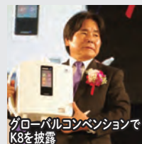
グローバルコンベンションでK8を披露