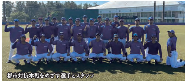
都市対抗本戦をめざす選手とスタッフ

ハードな練習の成果を試す機会としてはまず3月16日からの石川杯争奪戦があり、次いで4月20日からはいよいよ都市対抗第一次予選が始まります。硬式野球部の選手・スタッフは念願の(東京ドームでの)本戦出場をめざし、日々、熱心に練習に取り組んでいます。みんなで応援しましょう！