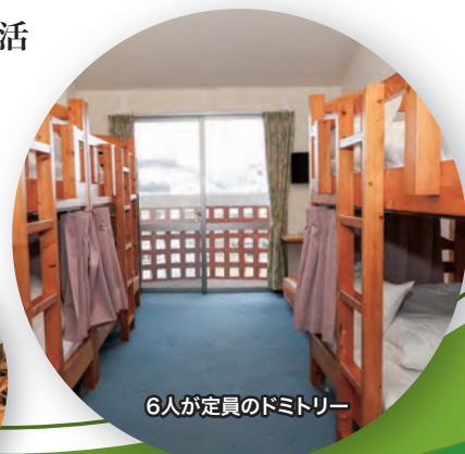
6人が定員のドミトリー

この食事の調理に活用しているのがレベラックの生成する電解水である。還元水は炊飯からスープ・みそ汁、食材の洗浄などにフル活用し、強酸性電解水は清掃・除菌など衛生管理面で活躍中だ。