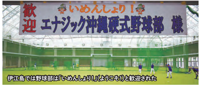
伊江島では野球部は「いめんしより!」(ようこそ!)と歓迎された