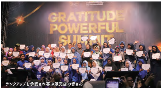
ランクアップを承認され喜ぶ販売店の皆さん

インドネシア最大級のディストリビューター・コミュニティ「Komunitas Amazing Truehealth」(KAT)は、12月17日、ジャワ島のスラバヤで「Gratitude Powerful Summit」(GPS)を