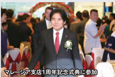
マレーシア支店1周年記念式典に参加