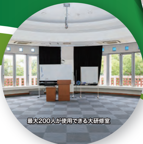
最大200人が使用できる大研修室