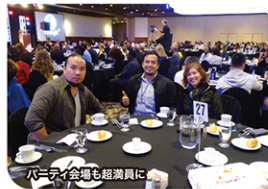
パーティー会場も超満員に