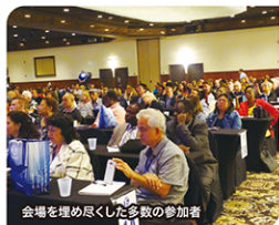
会場を埋め尽くした多数の参加者