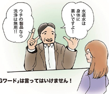
「NGワード」は言ってはいけません!

勧誘を始める際には、氏名・社名、商品の種類、勧誘目的をきちんと事前に告げなければならぬのです。