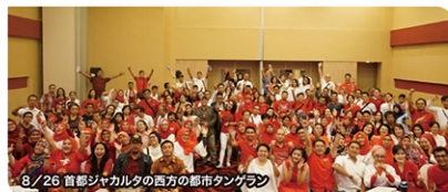
8/26 首都ジャカルタの西方の都市タンガラン