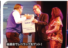
抽選会でレバレッジをゲット!