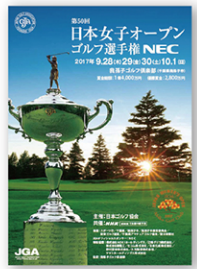
優勝賞金2,800万円の日本女子オープン