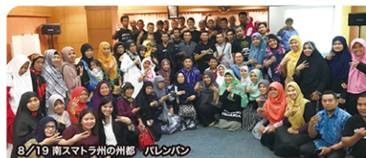
8/19 南スマトラ州の州都 パレンバン