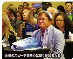
会長のスピーチを熱心に聞く参加者たち