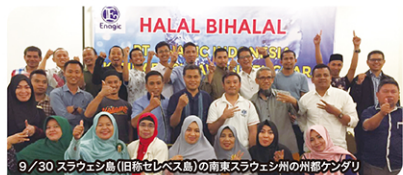
9/30 スラウェシ島(旧邦ゼレベ島)の南東スラウェシ州の州都ケンダリ