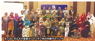
8/20 ボルネオ島東カリマンタン州の州都サマリンダ