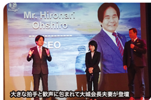
大きな拍手と歓声に包まれて大城会長夫妻が登場