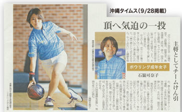
沖縄タイムス(9/28掲載)