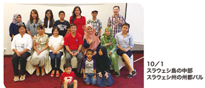
10/1 スラウェシ島の中部スラウェシ州の州都パロ