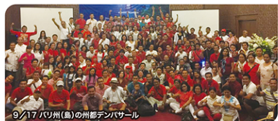
9/17 バリ州(島)の州都デンパサール

カードや6Aボーナスの説明、そして機械のメンテナンスのノウハウの説明にまで実在に盛りだくさんの内容でした。開催日と開催場所は以下の通りです。