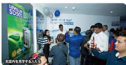
支店内を見学する人々