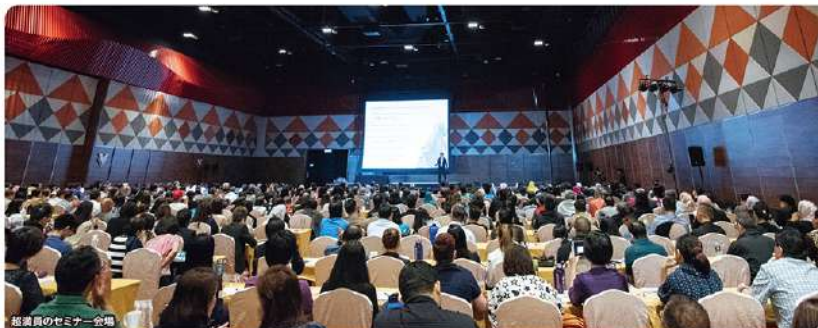
経営者のセミナー会場