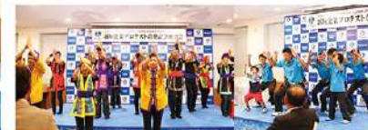
合格を祝って披露された余興の数々