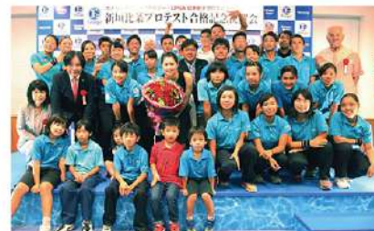
エナジックゴルフアカデミーの後輩たちも揃って祝福