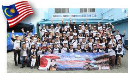
マレーシアの訪問団

10月11日にマレーシアから、30日にはフランスから大勢の販売店が大阪工場を訪れレバックの製造工程を見学しました。フランスの販売店はそのあとに沖縄を訪れ、エナジック発祥の地・名護市瀬嵩の名施設を始め、各地の関連施設・企業を回ってエナジックの原点を体感していました。