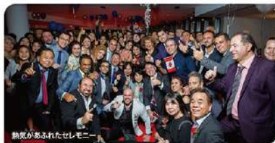
熱気あふれたセレモニー

あいさつに立った大城会長は、「いよいよ中東に拠点を置くことができました。これにより真のグローバル化が実現し、「情けの和」を世界中に広めることができるでしょう」と熱い期待感を表明していました。