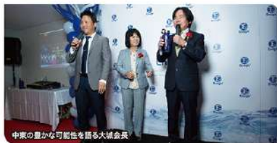
中東の豊かな可能性語る大城会長