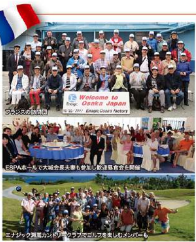
フランスの訪問団