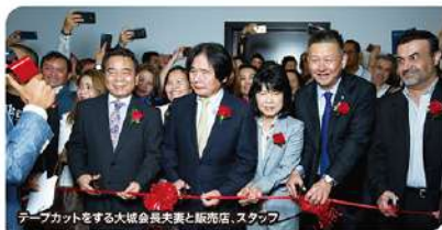
テープカットをする大城会長夫妻と販売店、スタッフ