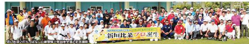
思い出深い打ちっぱなしの練習場で参加者全員と記念撮影