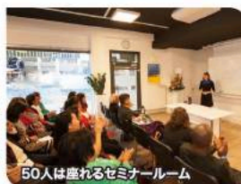
50人は座れるセミナールーム