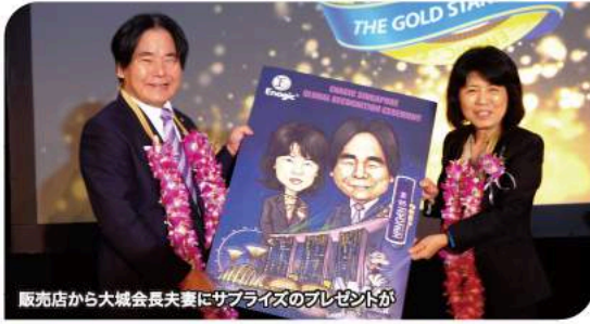
販売店から大城会長夫妻にサプライズのプレゼントが