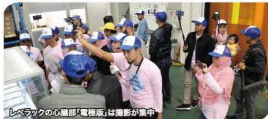
レベラックの心臓部「電極版」は撮影が集中