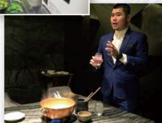
締め雑炊にはスタッフが還元水を足していただく

If you know of any unique use for electrolyzed water, we'd love to hear from you! 電解水のユニークな活用法を募集中!