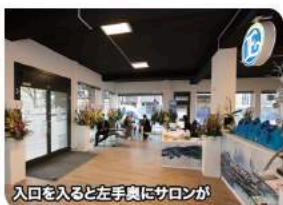
入口を入ると左手奥にサロンが