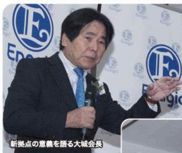
新拠点の意義を語る大城会長