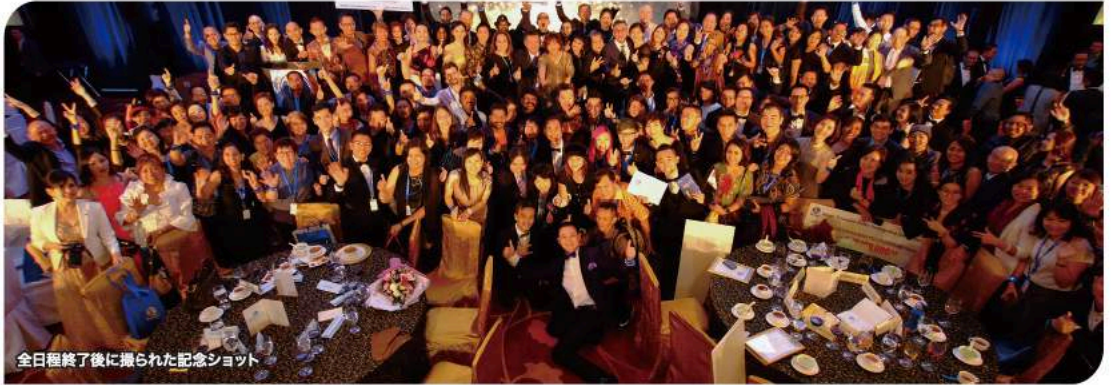
全日程終了後に撮られた記念ショット