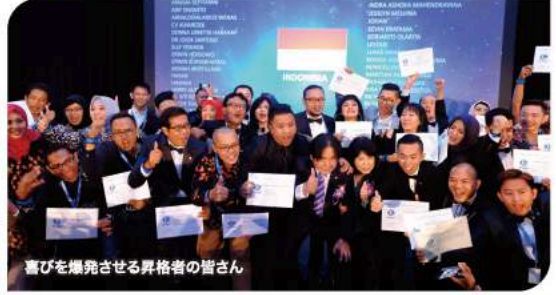
喜びを爆発させる昇格者の皆さん