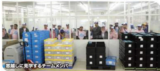
意欲的に見学するチームメンバー