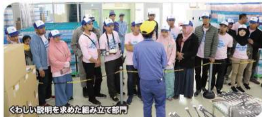
くわしい説明を求めた組み立て部門

訪問団は到着するとまず、2階ホールで担当社員から工場の概況を聞き、それから各部門の見学を開始しました。それぞれの生産部門では説明役の社員に熱心に質問をしたり、写真を撮ったりと世界最先端の「メイドインジャパン」の現場から学ぼうとする意欲が感じられました。