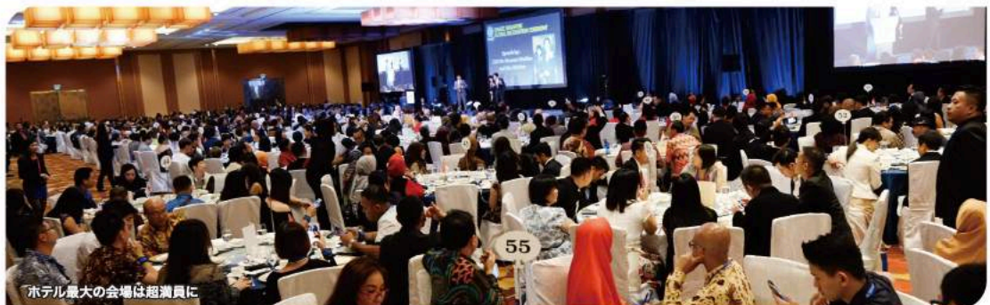
ホテル最大の会場は超満員に