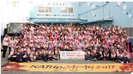
和気あいあいの正門前の記念撮影