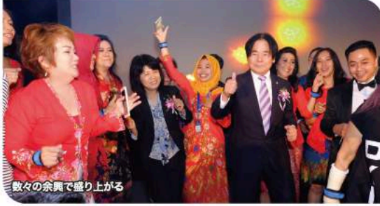
数々の余興で盛り上がる