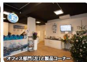
オフィス部門(左)と製品コーナー