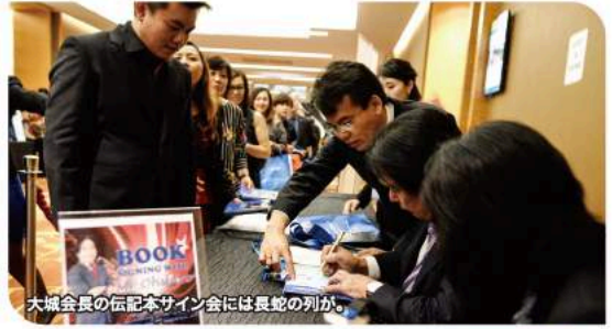
大城会長の伝記本サイン会には長蛇の列が。