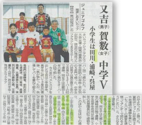
しおさいカップの結果を報じる「沖縄タイムス」(11月24日付)

ジュニアゴルファー（小中学生）の育成を目的に、沖縄県で毎年、開催されている「残波しおさいカップジュニアゴルフ大会」（第10回）が11月23日に実施され、エナジックゴルフアカデミー所属の選手が大活躍しました。