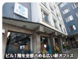
ビル1階を全部占める広い新オフィス