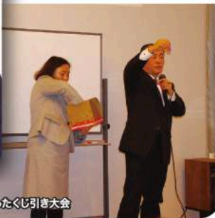
盛り上がったくじ引き大会