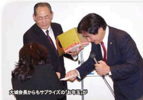
大城会長からもサプライズの「お年玉」が