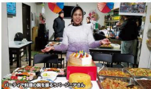
パーティーで料理の腕を振るうバージニアさん

If you know of any unique use for electrolyzed water, we'd love to hear from you! 電解水のユニークな活用法を募集中!