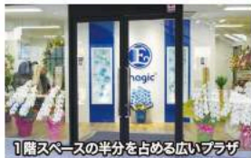
1階スペースの半分を占める広いプラザ