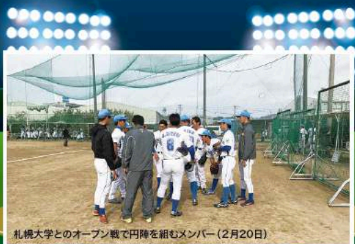
札幌大学とのオープン戦で円陣を組むメンバー(2月20日)