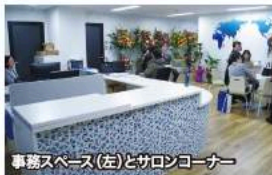
事務スペース(左)とサロンコーナー