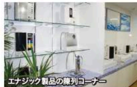
エナジック製品の陳列コーナー

住所: 大阪市淀川区宮原4-1-45 新大阪八千代ビル 1F AB室 電話: 06-6152-5407 FAX: 06-6152-5408