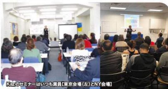
Kazのセミナーはいつも満員[東京会場(左)とNY会場]

させるためのノウハウを提供しています」と彼はいます。実際、セミナーを見ていますと初心者の販売店(あるいはゲスト)が明らかに感銘を受けた様子で、終了後にはそうした人たちがKazと一緒に記念撮影をしようと殺到していました。なお「Kazセミナー」は4月にも日本で開催されます(スケジュールは下記のとおり)。ふるって参加しましょう!