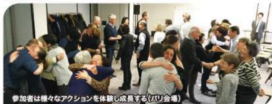
参加者は様々なアクションを体験し成長する(パリ会場)

えて「ビジネスの心構え」をわかりやすく説きました。参加者は一語一語に深くうなずき、経験豊かな磯部本部長の話に聞き入っていました。