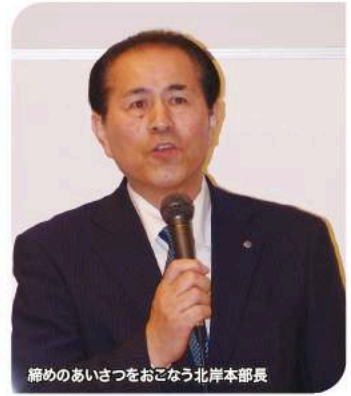
締めあいさつをおこなう北岸本部長