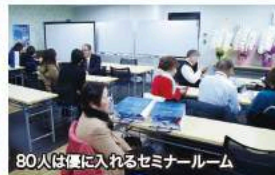
80人は優に入れるセミナールーム