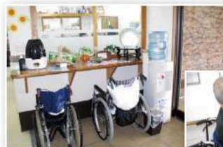
玄関に設置されたプロミスト(左)と還元水サーバー