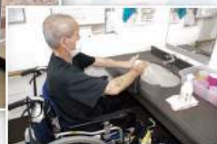
常備された強酸性電解水で手指の洗浄をする入居者

If you know of any unique use for electrolyzed water, we'd love to hear from you! 電解水のユニークな活用法を募集中!