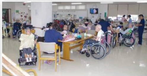
あい愛・び〜す館1階のリビングでつくるくお年寄り

レベラックは2016年冬に導入し、現在は2施設でスーパー501が2台とSD501およびレベラックR各1台が稼働中。還元水は飲用と調理全般に活用し、強酸性電解水は前述の使用法のほか、まな板・包丁の洗浄や床掃除に活用している。強還元水は油污れ対策や全館の床のモップかけなどに使って、効果をあげている。あい愛・び〜す館(そして、「ていんが〜ら」)は、強電解水のフル活用で安心安全な介護施設なのである。