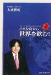
【前原利夫・著】『小さな島から世界を飲む!』より

十数年前に遡るが、実は中国大陆でランチ開設を試みたことがある。しかし、長い時間と大きな費用をかけた果てに開設が却下された、という苦い経緯があった。人間、一度失敗や嫌な体験をすると、また同じ失敗を繰り返したくない、こっそり尻尾を巻いて逃げ出すものだ。経営理論の一つは「損失が避けられないなら最小限に留める」であろう。しかし、大城にはそのような理屈は通用しないのである。