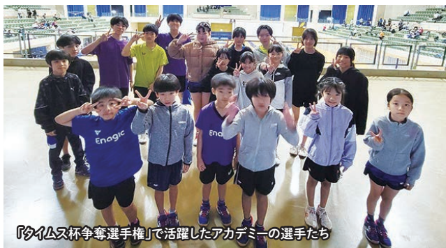
『タイムス杯争奪選手権』で活躍したアカデミーの選手たち

3月21、22日に秋田県由利本荘市で行なわれる「第23回全国ホープス選抜卓球大会」にエナジック卓球アカデミーの選手が2人参加することになりました。