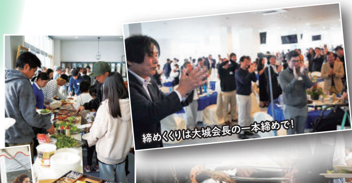
締めくくりは大城会長の一本締めで!